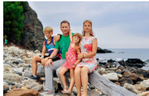
На отдыхе с семьей