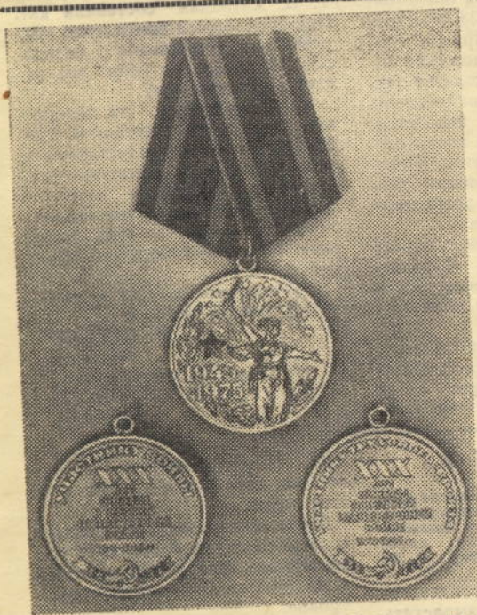
Юбилейная медаль «30 лет Победы в Великой Отечественной войне 1941—1945 гг.».